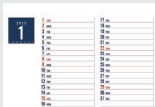
1月スケジュールメモ(表紙の裏面)