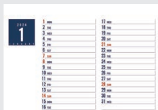
1月スケジュールメモ(表紙の裏面)