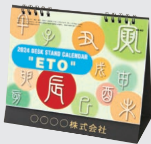
スケジュールシール