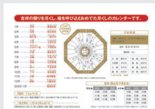
方位吉凶表・厄年表(2枚目の表面)