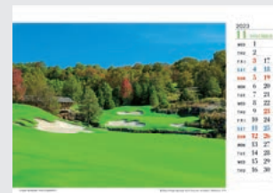
11月 Buffalo Ridge Springs G.C.(Missouri)