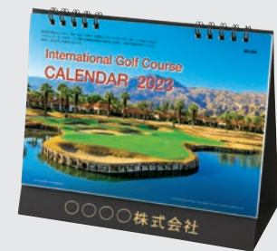
PGA West Tournament C.(California)