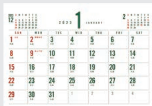
1月スケジュールメモ(表紙の裏面)